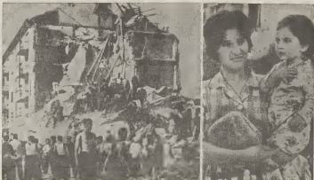
Riba e promer grafica nos por mira un bista di e desastre cu a pasa na Skopje, Yugoslavia, Y riba e otro grafica ta aprecé un muher yugoslava, sin hogar, cu angustia riba su cara, cu su yiu den su brazos.

Algun bomber tabata bisa: E ta hibo, e ta hibo. Nan a sacami for di e ruinanman. Awor mi ta den hospital, pero ningun bendenan sabi loke a pasa cu mi famia".